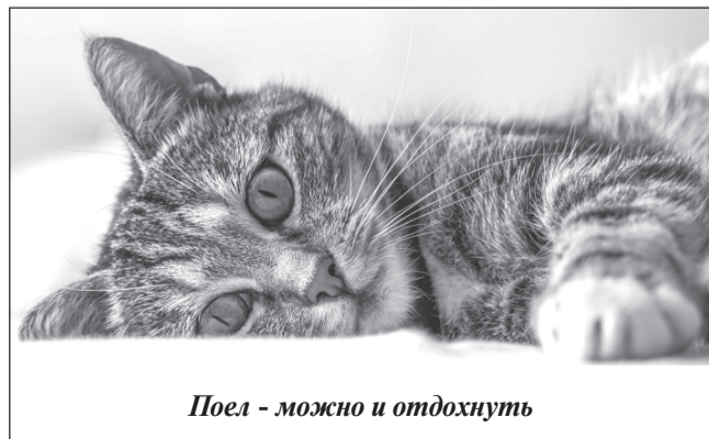
Поел - можно и отдохнуть

Порезы. При порезах первым делом осмотрите рану. Если она неглубокая и не сильно кровоточит, обработайте ее антисептическим раствором (перекись водорода, хлоргексидин), по возможности перебинтуйте и обратитесь к ветеринарному