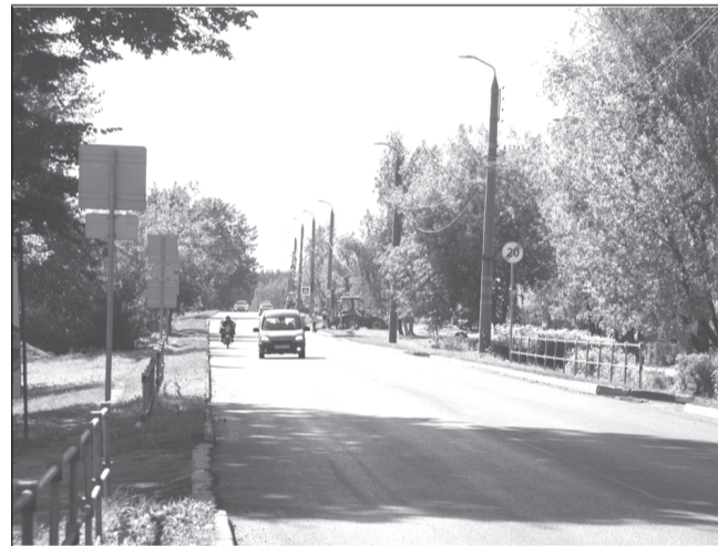
Программы ремонта дорог сформированы на 2 года вперед.

Губернатор также поддержал предложение начальника департамента дорожного хозяйства и транспорта сформировать на уровне муниципалитетов программу ремонта местных дорог на среднесрочный период — до 2023 года, чтобы с учетом этих решений планировать и конкурсные процедуры, и заявки в федеральный центр на софинансирование работ.