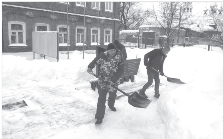
Уважение к памяти земляков волонтеры подкрепляют конкретными делами

В Приволжском районе, как и в других муниципалитетах региона, волонтеры не забывают о пожилых одиноких земляках и сразу же реагируют на сигналы о помощи с расчисткой снега.