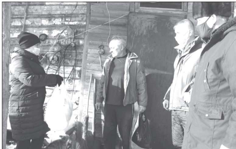
Не бросать товарища в беде - принцип работы общественной приёмной и «Боевого братства»