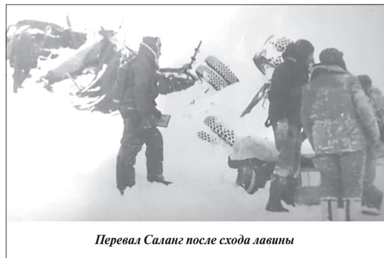
Перевал Саланг после схода лавины

кроме офицеров ВДВ, находился спецназ ВДВ и врачи госпиталя имени Бурденко. После взлета генерал А. И. Лебедь вызвал