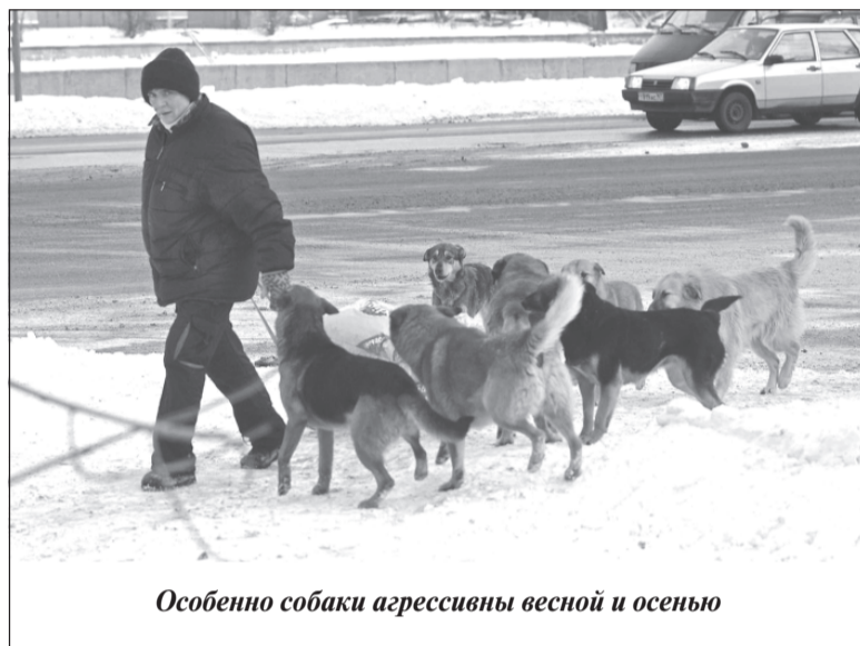
Особенно собаки агрессивны весной и осенью

ко. Они, прикармливаемые жалостливыми горожанами, считают территорию «своей» и защищают ее. Агрессию может вызвать конкретный пешеход или если у собаки что-то болит. Даже пугливое вне своры животное в своре может вести себя совсем по-другому.