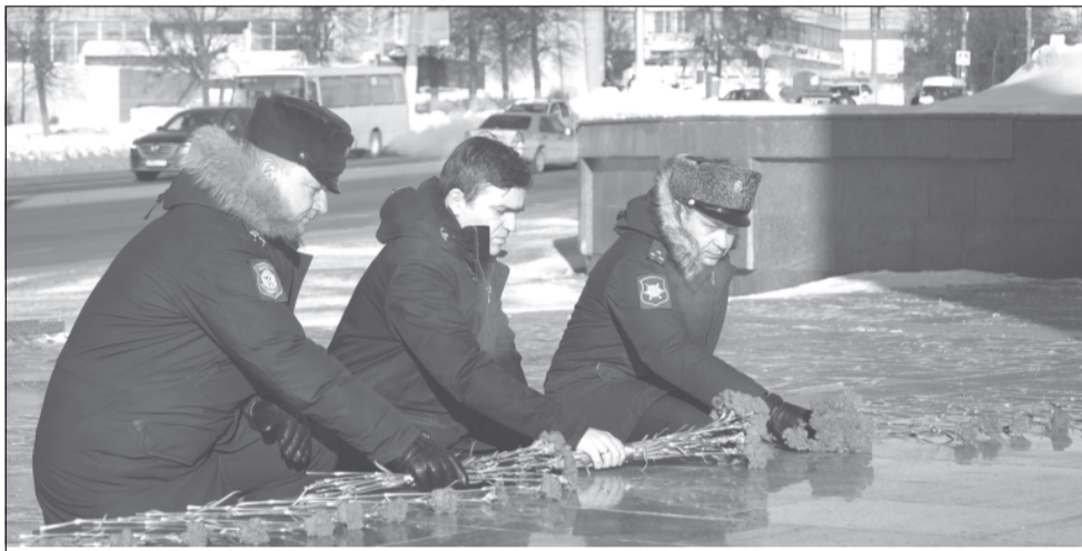
Возложение цветов к мемориалу Героям фронта и тыла в Иванове.

98-я воздушно-десантная гвардейская дивизия, 112-я гвардейская ракетная бригада, 54-я ракетная дивизия и 610-й Центр боевого приме-